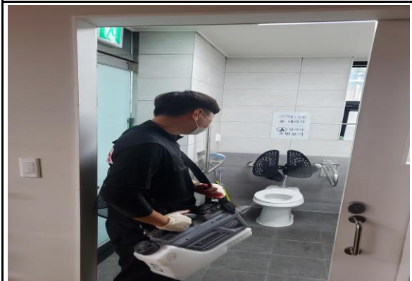
초미립 ULV살균 소독 실시 다수가 이용하는 화장실 세면대, 변기, 문 등 시설물 표면에 가염병예방을 위하여 집중적으로 멸균제 살포