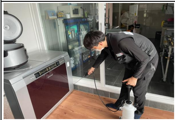
잔류분무 살충 소독 실시 취약구역(구석진곳, 습한곳, 점검 후 살충제 살포