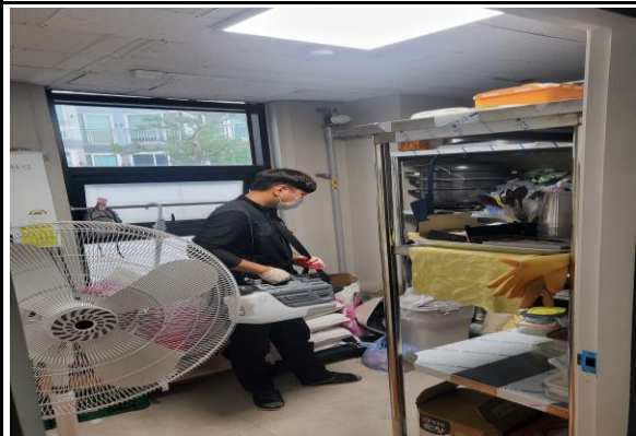
초미립 ULV살균 소독 실시 환경부승인을 받은 멸균제를 이용하여 주방기기 표면에 꼼꼼하게 소독 실시