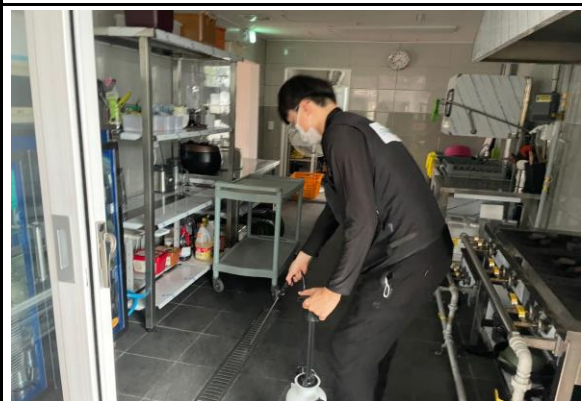
잔류분무 살충 소독 실시 해충의 서식 방지를 위하여 취약구역 점검 후 살충제 살포