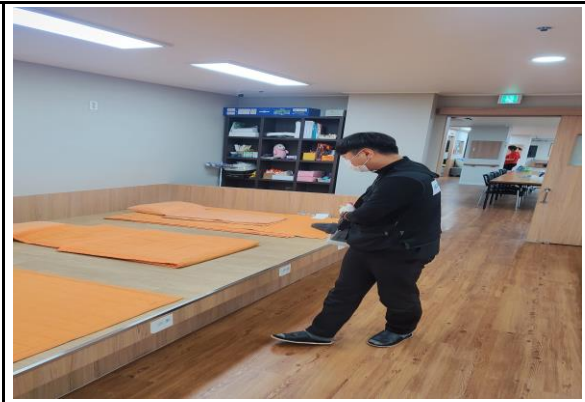
초미립 ULV살균 소독 실시 시설물 전 구역 유해바이러스 살균을 위하여 사람의 손이 닿을 수 있는 물체 표면 및 공간에 소독 실시